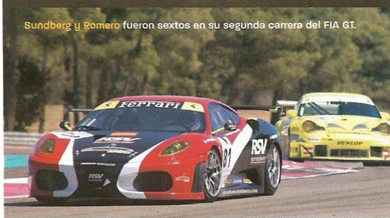
Sundberg y Romero fueron sextos en su segunda carrera del FIA GT.